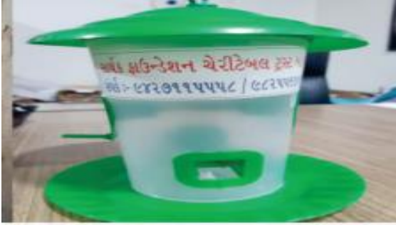
૪૦ નંગ પક્ષીઓના ચણના પાત્રનું નિ:શુલ્ક વિતરણ

સાર્થક ફાઉન્ડેશન દ્વારા અબ્બોલજીવ માટે 50 લીટરના 450 જેટલા પીવાના વાસણોની વ્યવસ્થા કરવામાં આવી છે અને ખાવાના વાસણોની પણ વ્યવસ્થા કરવામાં આવી છે