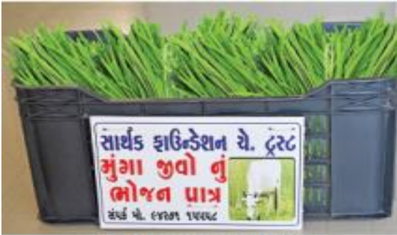
૨૫ નંગ ભોજન પાત્રનું નિ:શુલ્ક વિતરણ