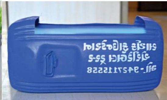
ખાવાના વાસણોની વ્યવસ્થા કરવામાં આવી છે