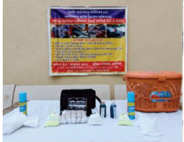
ઉત્તરાયણ દરમિયાન પક્ષી બચાવો કેન્દ્ર