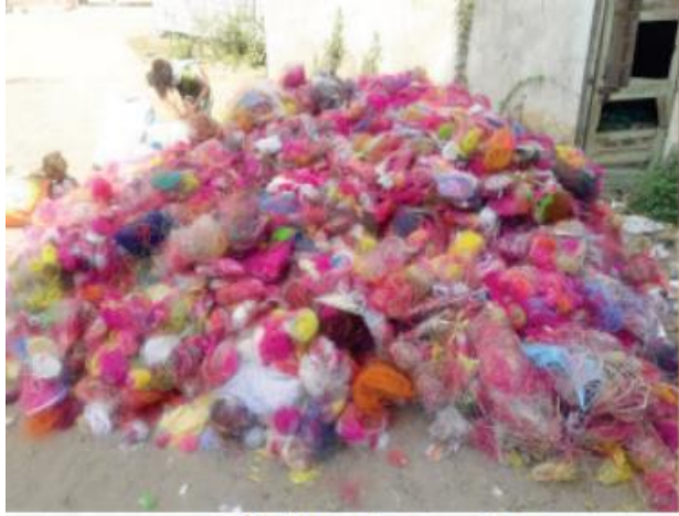
૬૫૦ કિલો પતંગના દોરા એકત્રિત કર્યા

અને 2022માં 650 કિલોગ્રામ દોરા એકત્રિત કરવામાં આવ્યા હતા. વિદ્યાર્થીઓ દ્વારા કરવામાં આવેલ આ પરોપકારી કાર્ય માટે સાર્થક ફાઉન્ડેશન અને ભરૂચ વનવિભાગ દ્વારા લગભગ 5000 વિદ્યાર્થીઓને પ્રમાણપત્ર આપવામાં આવે છે.