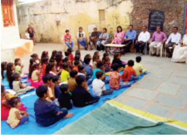
બાળ સંસ્કાર કેન્દ્ર ખાતે વિવિધ સ્પર્ધાઓનું આયોજન

1)સાર્થક ફાઉન્ડેશન બાલ સંસ્કાર કેન્દ્રનું આયોજન કરે છે. આ બાલ સંસ્કાર કેન્દ્રમાં લગભગ 40-50 બાળકો નિયમિતપણે ભાગ લે છે જ્યાં તેમનો સાંસ્કૃતિક વિકાસ થાય છે. સાર્થક ફાઉન્ડેશને બાળકોના સાંસ્કૃતિક વિકાસ માટે ભૂતકાળમાં પણ અનેક કાર્યક્રમોનું આયોજન કર્યું છે