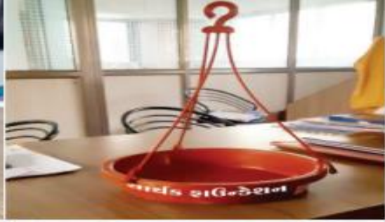
૬૦૦ નંગ પક્ષીઓને પાણી પીવાના પાત્રનું નિ:શુલ્ક વિતરણ