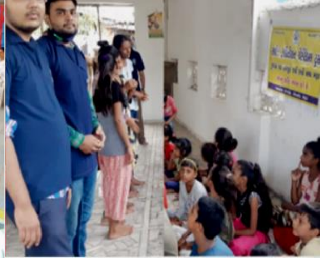
બાળ સંસ્કાર કેન્દ્ર